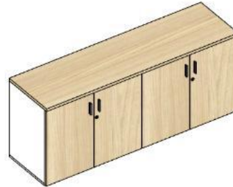
DESCRIPCIÓN Cubierta HPL25 MAD EMB Gabinete pedestal 2P 800X450X725H