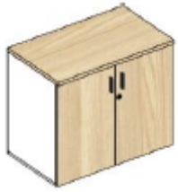
Gabinete bajo 2P 750X450X750H INTEGRALE ST