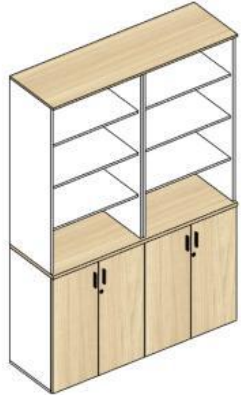
Gabinete bajo doble altura 2P 700X450X900H INTEGRALE ST Cubierta Compartida Librero 3R abierto 700X370X1250h INTEGRALEST Cubierta Compartida