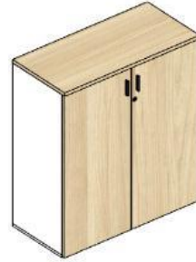
Gabinete medio 2R 2P 950x450x1200h INTEGRALE ST