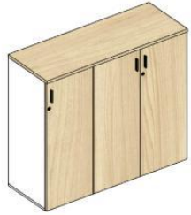
Gabinete medio 2R 1P 400x450x1200h INTEGRALE ST Gabinete medio 2R 2P 800x450x1200h INTEGRALE ST Cubierta Compartida