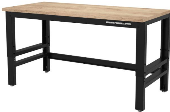
6 Un Mesón de trabajo estructura metálica y cubierta de terciado estructural =18 mm medidas 2x1x0.87 mt (6 Un sede Illapel)