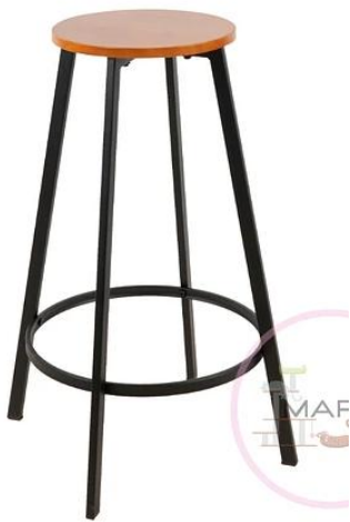
25 Un TABURETE 0,75 de alto Base madera, con estructura y patas de metal. (25 Un Illapel)