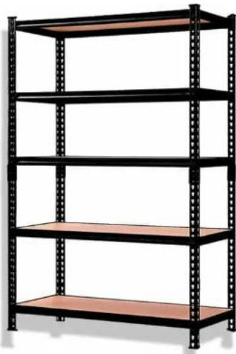
2 Un Estante metálico tipo mecano, estructura de acero y cubiertas de terciado estructural (2 Un sede Illapel)